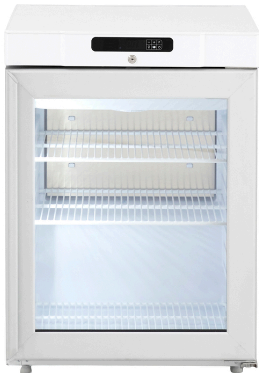
TABLE TOP POSITIF BLANC VITRE 125 L