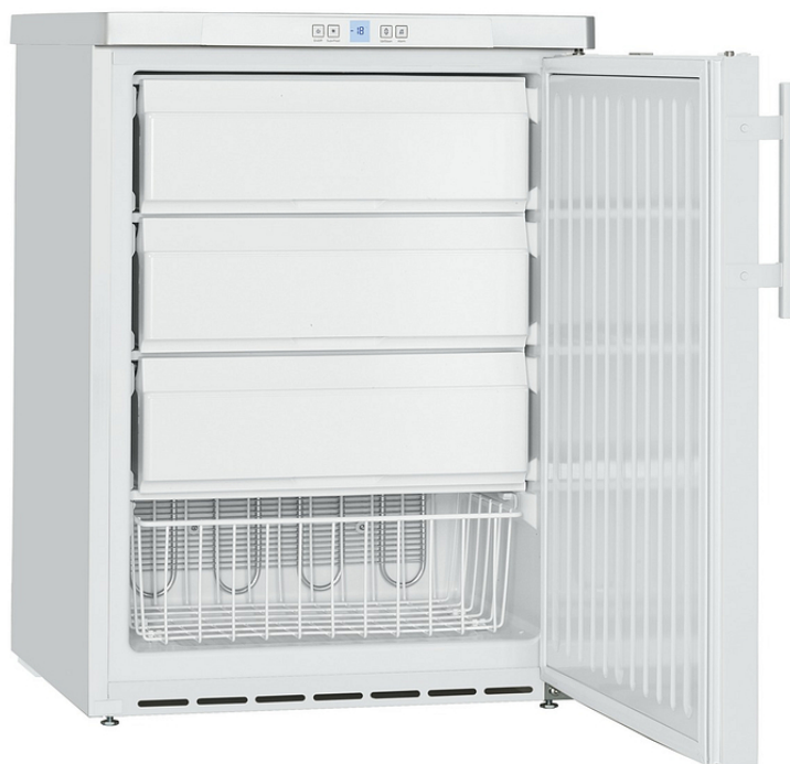
Table top négatif, carrosserie epoxy blanc, 143L